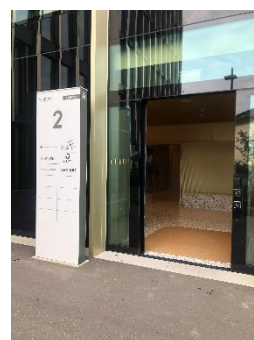
Eingang zu konplan