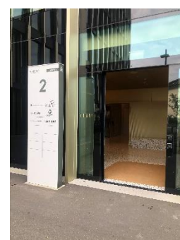
Eingang zu konplan