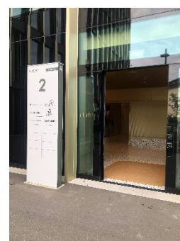
Eingang zu konplan